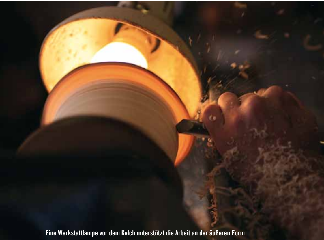
Eine Werkstattlampe vor dem Kelch unterstützt die Arbeit an der äußeren Form.